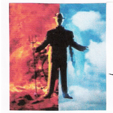
Resim - 1