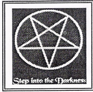
Şekil -3 Pentagram

Ters çevrilmiş haç işareti; Hristiyanlıkta dini bir sembol olarak kullanılan ve başta İsa'nın insanları ezeli günahlarından kurtarmak üzere kendisini feda etmesi olmak üzere Hristiyanlarca pek çok anlamı olan Haç'ın ve dolayısıyla onun etrafında oluşan inanç ve telakkilerin reddedilişi veya ters çevrilişi anlamına gelmektedir. 77