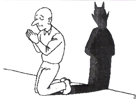
Resim - 2

2. Resim: Her insanın içinde bir şeytan yatmaktadır. Bu zaman zaman ortaya çıkar arkadaki gölgeye dikkat edilirse bu gölge boynuzları olan sivri kulaklı şeytani sembolize eden karikatürize bir resimdir. Bu resim insanların farkında olmayarak şeytani güç ve özellikler taşıdığını anlatıyor.